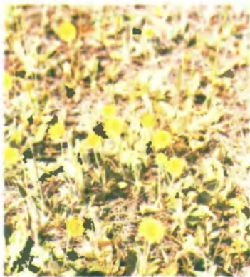
561. Нечуйвітер волохатенький.